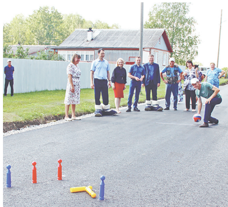
На новеньком асфальте жители и гости сыграли в боулинг по-сафоновски, домино...