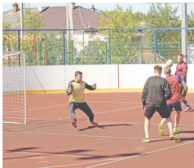
В футбольном турнире участвовали четыре команды.