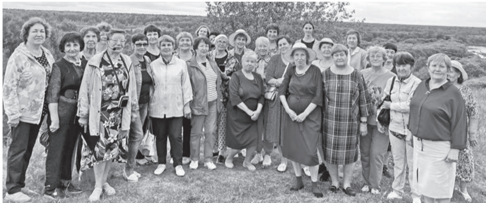
На еланских буграх.

Гостеприимство и радушие ляпуновцев осталось хорошим воспоминанием для нас. Возвращаясь домой, обменялись мнениями и впечатлениями.