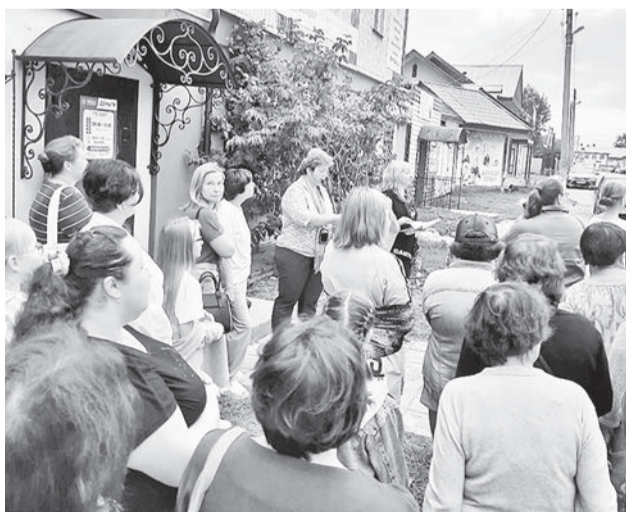
Пешая экскурсия по Байкалово.

Пройдя по селу, мы увидели памятник отцу и двум его сыновьям, расстрелянным в гражданскую войну белогвардейцами, магазин купчихи Ляпуновой и узнали, что она была дочерью купца Дмитрия Бахарева, который впоследствии дал ей денежные средства на строительство этого здания. Работники Дома культуры пригласили нас на чашку чая из местных трав.