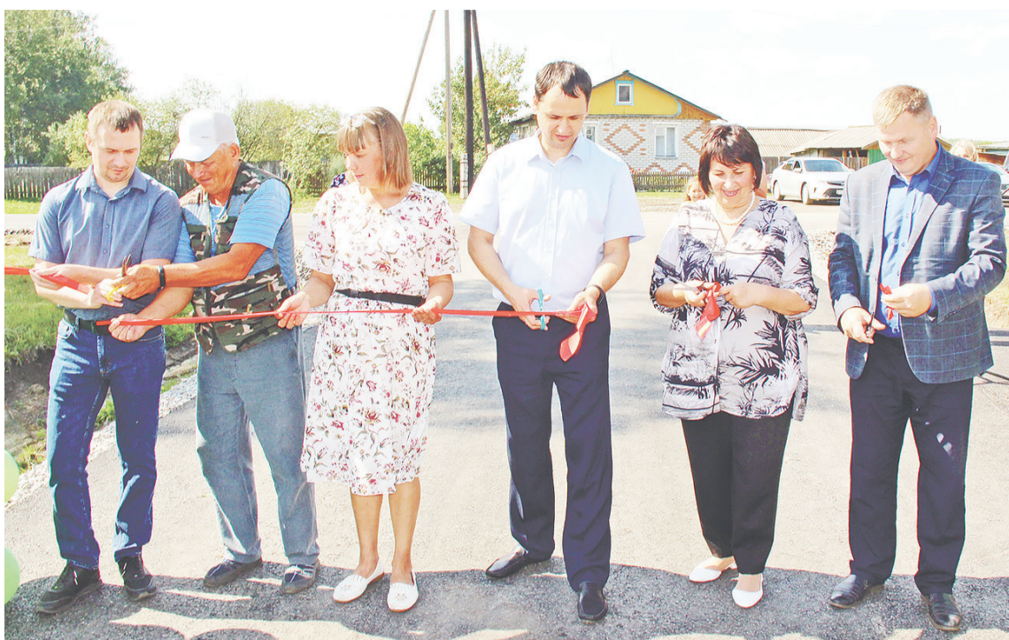
Торжественный момент: красная ленточка разрезана, дорога открыта.