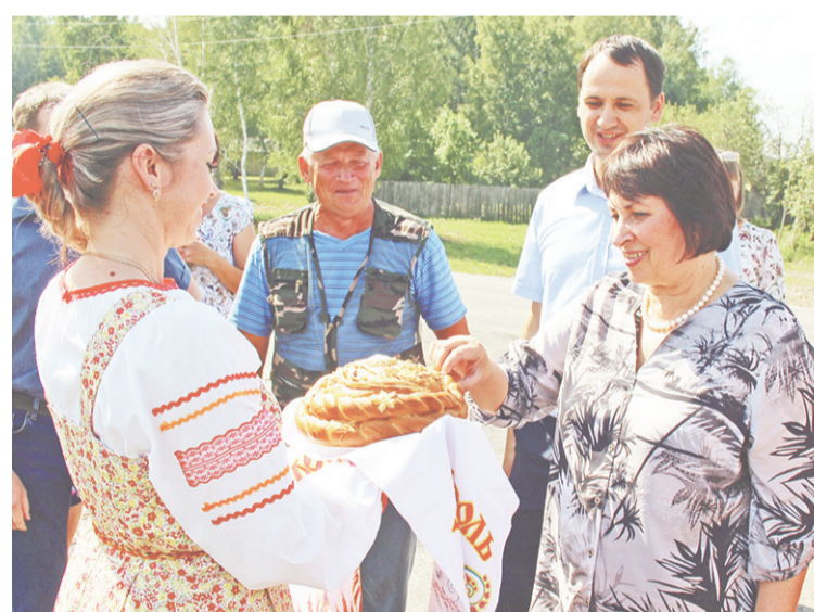
Гостей по старому русскому обычаю встретили пышным караваем.

Наступил торжественный, по-настоящему историче-