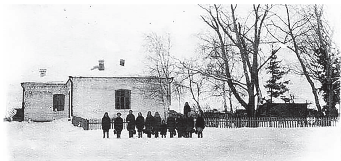
Баженовская школа ещё без пристроя.